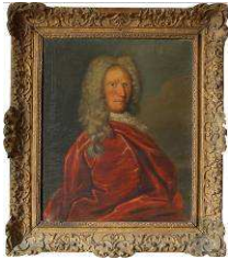
Portrait de Michel Joseph Dubocage de Bléville (1676 – 1727).