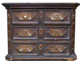
Cabinet muni de six tiroirs.

Fabriquée en Chine pendant son voyage sur la Découverte (1707-1716).