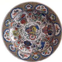
Plat au chien de Fô.